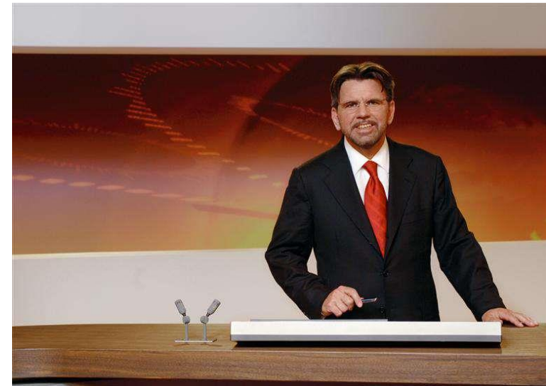
Stephan Klapproth (Journalist und Fernsehmoderator)

Sonntag 11. Juni 2017 – 15:00 Uhr Château de Prangins 1197 Prangins